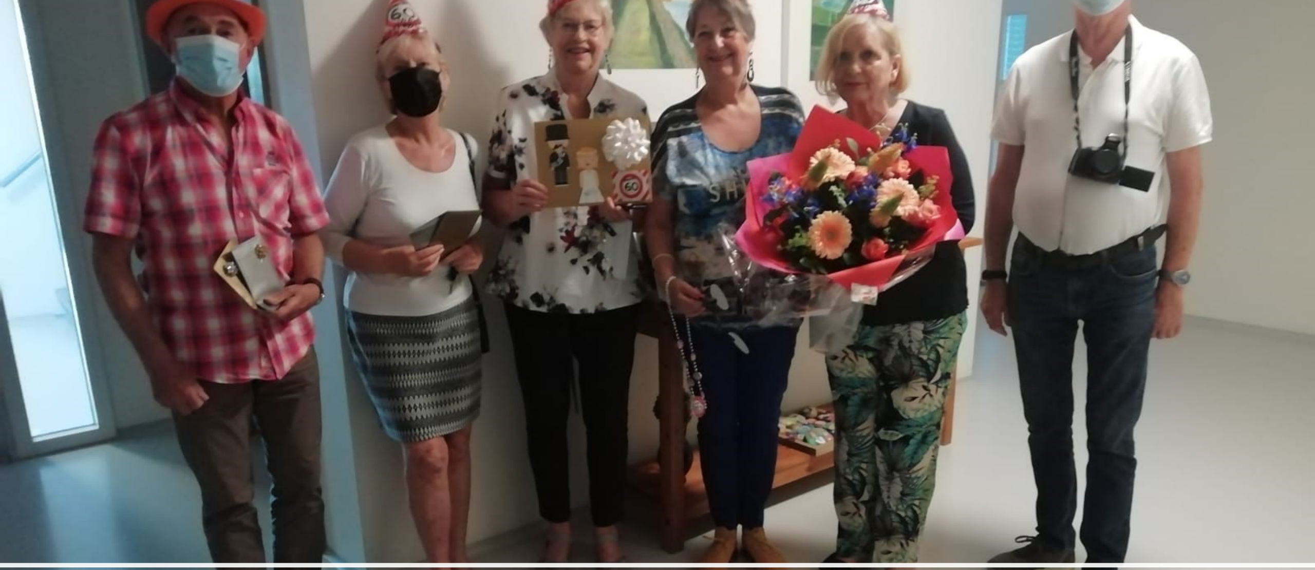
Gestippeld wonen, woongroep Terwijde, Utrecht