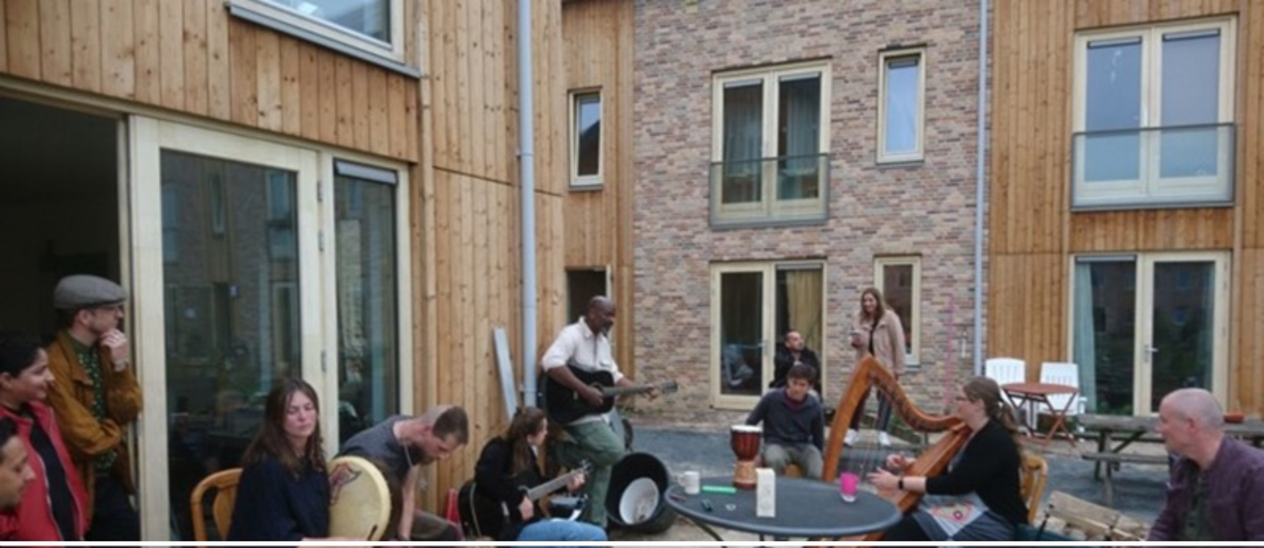
Ecodorp Zuiderveld, Lent